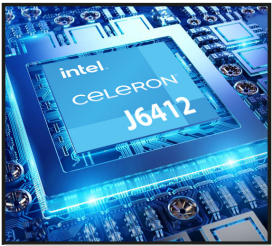
Intel® Celeron® J6412 (Cache de 1,5 M, jusqu'à 2,6 GHz)

Système sans ventilateur, il dispose d'un écran Full HD de 21,5", facilitant la lecture et la navigation dans les menus et les commandes.