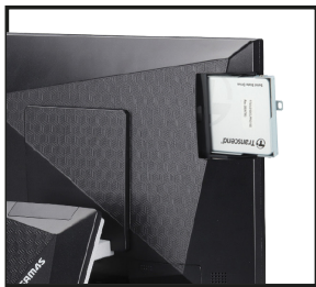
Fácil acceso a SSD

Sapphire ofrece la combinación perfecta de imagen distintiva y servicio al cliente eficiente, lo que la convierte en la opción ideal para empresas que buscan diferenciarse en el mercado de punto de venta.