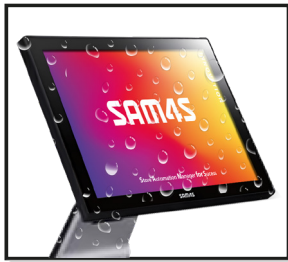
Panel frontal resistente al agua IP55