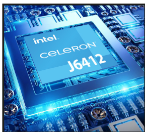
Intel® Celeron® J6412 (Cache de 1,5 M, hasta 2,6 GHz)