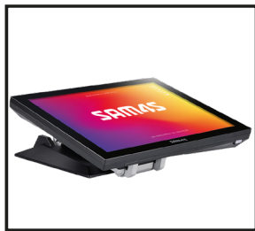
Varios ángulos de operación disponibles