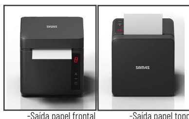
-Saída papel frontal