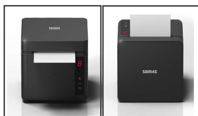
-Sortie papier frontal