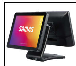
Display Cliente 15"