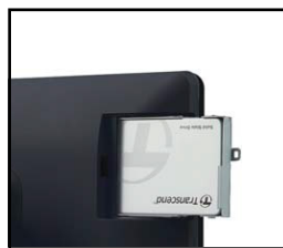
Fácil acesso ao SSD

Com as opções de suporte tradicional ou VESA para montagem em parede e poste, oferece grande flexibilidade de instalação.