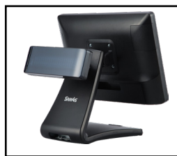
Display Cliente VFD