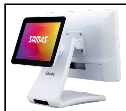
Display Cliente 9.7"