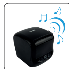
Campana de cocina