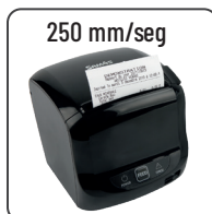
Impresión de alta velocidad