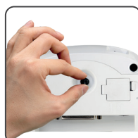
Diseño sin herramientas