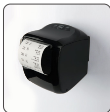
Montagem na parede