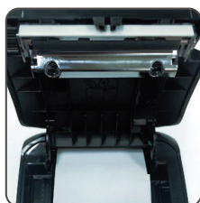
Cortador automático de cerâmica