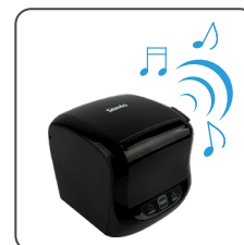
Campainha de Cozinha